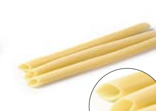
Penne Candela MPSELO0056