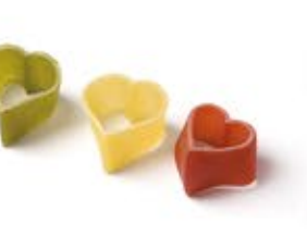
Cuori 3 Colori MPSELO0026