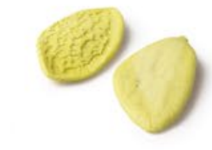
Foglie di Carciofo MPSELO0117