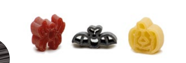
Halloween - Pomodoro/Bietola - Nero di seppia MPSELO0054