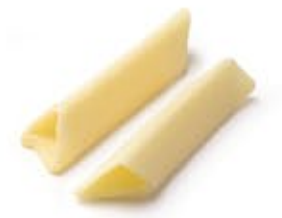
Penne Prisma MPSELO0149