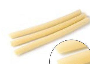
Mezze Candele MPSELO0176