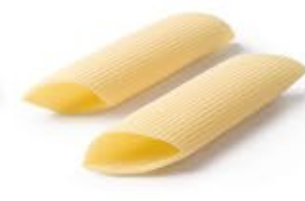
Pennoni Rigati MPSELO0014