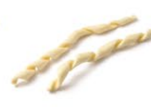
Fusilli Cilentani MPSELO0032