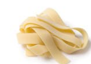
Pappardelle a Nido MPSELO0127