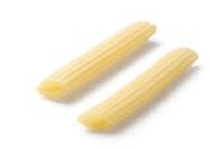
Pennette Rigate MPSELO0039