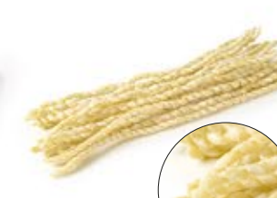
Fusilli Napoletani Lunghi MPSELO0139