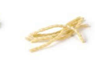
Fusilli Napoletani Corti MPSELO0513