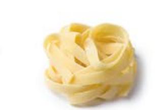
Tagliatelle a Nido MPSELO0133