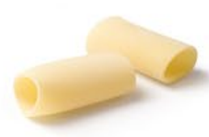
Paccheri Lisci MPSELO0009