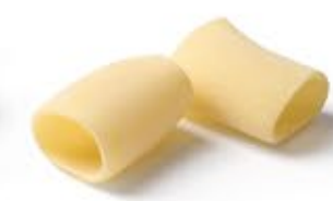
Mezzi Paccheri Lisci MPSELO0007