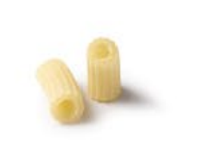
Tubetti Rigati MPSELO0061