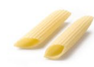
Penne Zite Rigate MPSELO0057