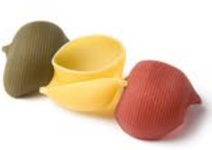
Lumaconi 3 Colori MPSELO0025