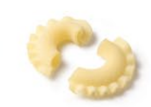
Creste di gallo MPSELO0049