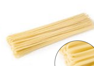
Spaghetti N.7 MPSELO0044