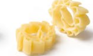
O'Sole Mio MPSELO0008