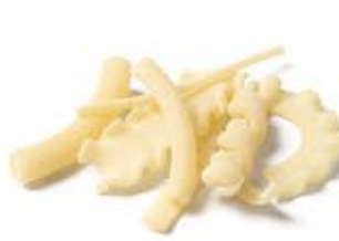
Pasta Mista MPSELO0137