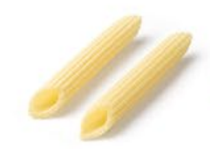
Penne Rigate MPSELO0155