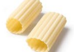
Paccheri Ondulati MPSELO0010