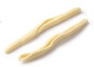
Filei Tropeani MPSELO0033