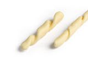
Fusilli Avellinesi MPSELO0031