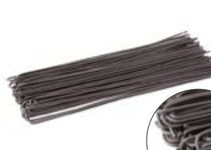
Spaghetti Nero Seppia MPSELO0136