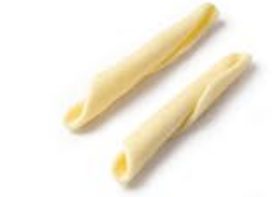
Fusilli Pugliesi MPSELO0030