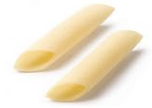
Penne Zite Lisce MPSELO0037