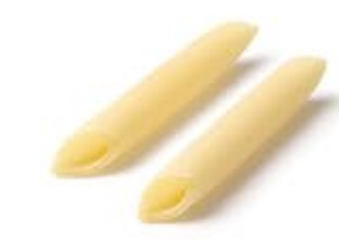
Penne Lisce MPSELO0038