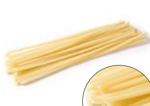
Ferretto Calabro MPSELO0004