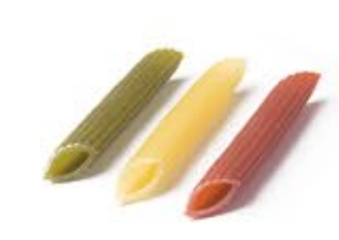
Pennette 3 Colori MPSELO0024