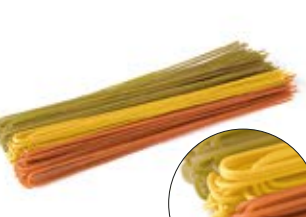
Spaghetti 3 Colori MPSELO0052