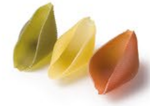
Conchiglioni 3 Colori MPSELO0022