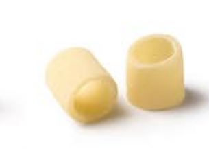
Tubettoni Lisci MPSELO0114