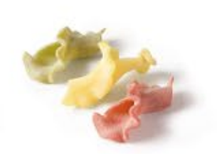
Gigli 3 Colori MPSELO0213