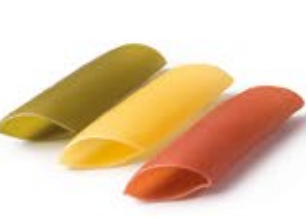
Pennoni 3 Colori MPSELO0023