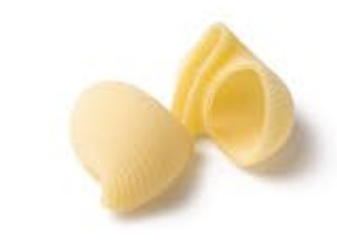
Lumache Medie MPSELO0051