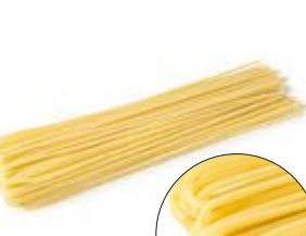
Spaghetti alla Chitarra MPSELO0078