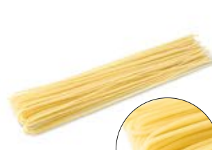
Spaghetti N.5 MPSELO0082