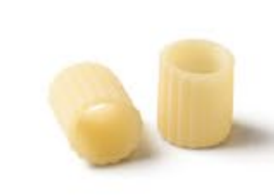
Tubettoni Rigati MPSELO0113