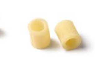
Tubetti Lisci MPSELO0041