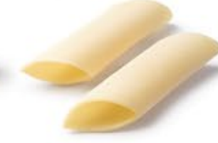
Pennoni Lisci MPSELO0013