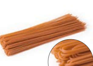
Spaghetti Peperoncino MPSELO0048