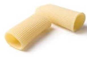
Paccheri Rigati MPSELO0011